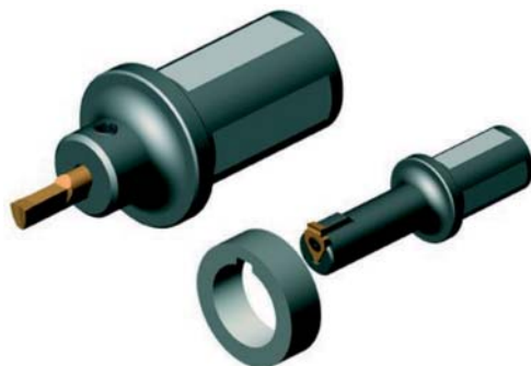
Rys. 14.1. Przykłady dłutaków, którymi można kształtować rowki na tokarkach CNC

Dłutowanie, na obrabiarce wyposażonej w podziałnicę, umożliwia wykonywanie na przykład wielokrotnych rowków wpustowych w otworach tulei bądź kół zębatach. Trzeba też zauważyć, że ten sposób kształtowania jest możliwy do